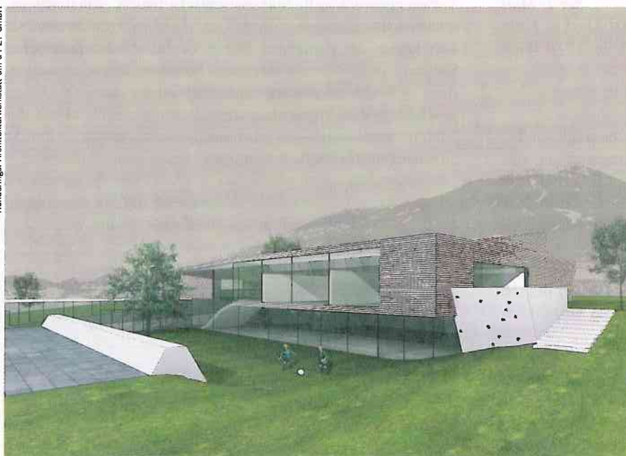
Renderings: Architekturwerkstatt din a4 ZT GmbH